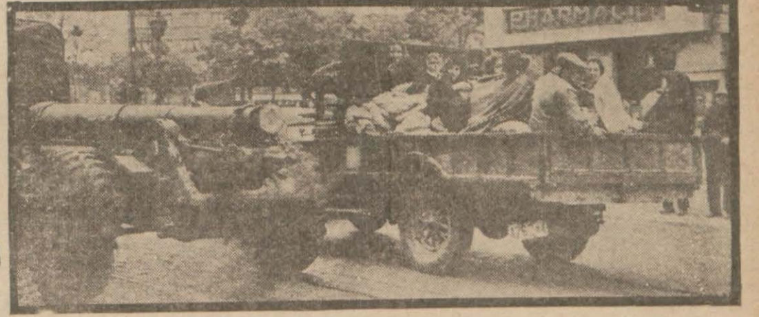
Bugünkü harbin hususiyetleri: Muhacir nakleden bir kamyonla yeni mevzi almağa giden ağır bir top yan yana

Nevyork 25 (Hususi) — Associated Press muhabiri Romadan bildiriyor: Arnayduğu ziyaret eden Kont Ciano ile maarif ve korporasyonlar nazırları, bugün Tiranadan ayrılmışlardır. Bazı mahfelle göre Kont Ciano, Roma aydetini müteakib Berlin'e giderek, Hitler ve Fon Ribbentrop ile görüşecek - tir.