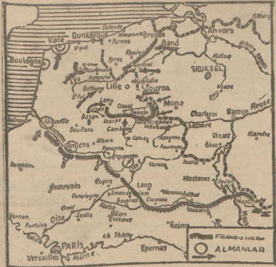
Almanların ve müttefiklerin iddialarına göre vaziyeti gösterir kroki

Manş kıyılarına mühim miktarda Alman motörlü kıt'aları geldi